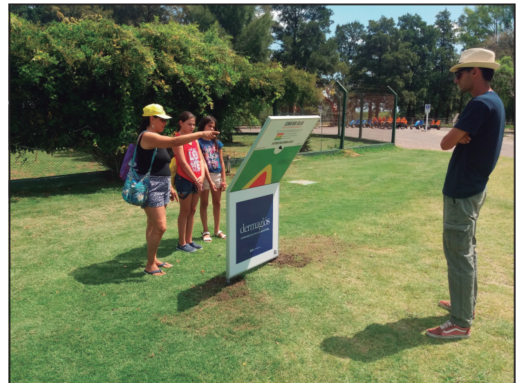
Semáforo Solar instalado en el Ecoparque Tálce (Flores)

termal de Salto como de la vecina ciudad de Paysandú.